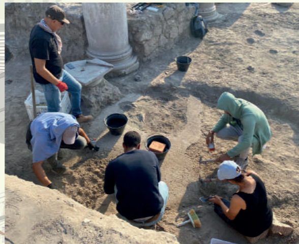
Res. 2: Kazı alanı çalışma fotoğrafı

Amanos Dağları'ndan su taşıyan su kemerleri (aqueductus), tiyatrosu, sportif yarış alanı (stasion), konser salonu (odeion), sütun revaklı galerisi (porticus / stoa), hamamı (thermae), tapınağı (templum), tahıl deposu (granarium), halk meclisi (bouleuterion), ve tapınağın üzerine Bizans Dönemi'nde inşa edildiği tespit edilen kilise (basilica) yapılarına sahip olduğu bilinen kent, Hatay'da arkeolojik varlığı en iyi korunmuş ören yeridir.