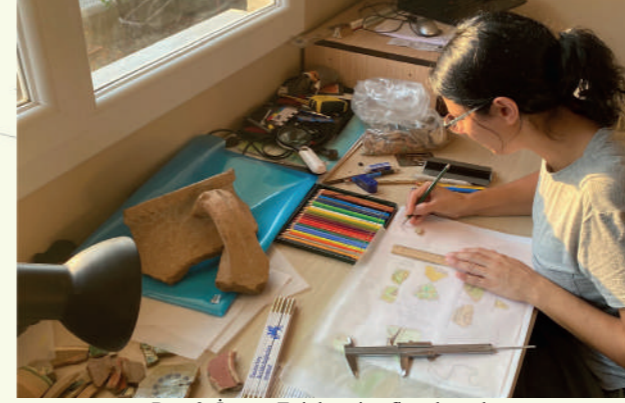
Res. 3: İssos - Epiphaneia ofis çalışmaları (2022 yılı kazı arşivi)

Kilikia Bölgesi'nde günümüze değin tespit edilebilmiş az sayıdaki meclis binasından biri Epiphaneia'da bulunur. Kentin Roma Dönemi'ndeki siyasi ve entelektüel açıdan yüksek konumunu değerlendirebilmek adına önemli bir göstergedir. Epiphaneia'da meclis binasının varlığı ideal yönetim şekli olan demokrasiye verilen önemi gösterir. Epiphaneia'da meclis binasının varlığı ideal yönetim şekli olan demokrasiye verilen önemi gösterir.