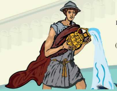
Res. 4: Takvimler mozaiği paneli canlandırması (M. Naif Sönmez)

Roma hakimiyeti sürecinde merkezi yönetimin ağırlık kazanmasıyla meclis binaları asal işlevlerinin yanı sıra mimarisinin uygun olması nedeniyle Odeion olarak adlandırılan müzik salonu işleviyle de kullanılmıştır.