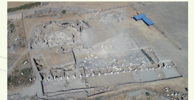
Res. 7: Kazı alanının 2022 yılına ait hava fotoğrafı (2022 yılı kazı arşivi)

T.C. Kültür ve Turizm Bakanlığı'na, T.C. Kültür Varlıkları ve Müzeler Genel Müdürlüğü'ne, Erzin Belediyesi'ne, Hatay Büyükşehir Belediyesi'ne, Erzin Ticaret Odası'na, Erzin esnaflarına ve Erzin halkına gösterdikleri destek ve ilgileri nedeniyle İssos-Epiphaneia kazı ekibi olarak teşekkür ederiz.