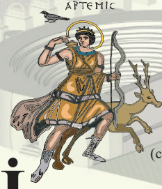
Hamam, Artemis mozaiği (canlandırma M. Naif Sönmez)

Hatay'ın En İyi Korunmuş Antik Kenti Gün Yüzüne Çıkıyor