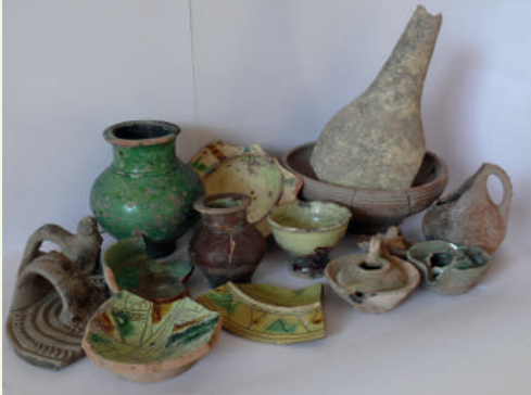
Res. 1: İssos - Epiphaneia kazılarında ele geçen seramik kaplardan bir grup. (2022 yılı kazı arşivi)

İssos – Epiphaneia antik kenti, günümüzde Hatay'ın Erzin ilçesi Gözeneler mevkiinde, antik adı İssos olan ovanın kuzeybatı köşesinde yer alır. İssos'un kökenleri Bronz Çağı'na, günümüzden yaklaşık 3500 yıl öncesine dayanan İssos Ovası'nın, eski çağlardan bu yana tarım ve hayvancılık açısından oldukça verimli olması, yerleşimin doğu-batı arasındaki ticaret rotasının önemli bir uğrak noktası olmasını sağlamıştır. Antik Dönem'de ovanın bereketli topraklarından faydalandığını, varlığını yazılı kaynaklardan öğrendiğimiz İssos-Epiphaneia'daki bir tahıl depolama binası (granarium) ortaya koyar.